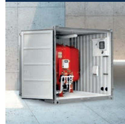
Druckhaltung- und Entgasung

Alle Serviceleistungen unter https://www.mobiheat.de/de/service